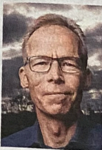
Johan Rockström är chef för Potsdam institute for climate research.